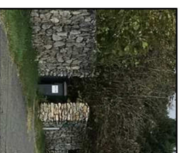
Mise en place d'un muret technique au droit des accès aux lots - parement en pierre