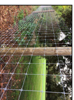
Clôtures sur les espaces naturels agricoles : grillage à malle souple / poteaux bois. Hauteur maximale 2,20m